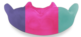
3 kleuren, + € 15,-