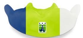
Club logo, + € 5,-