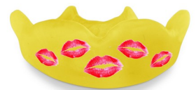
Pimpen, + € 12,50